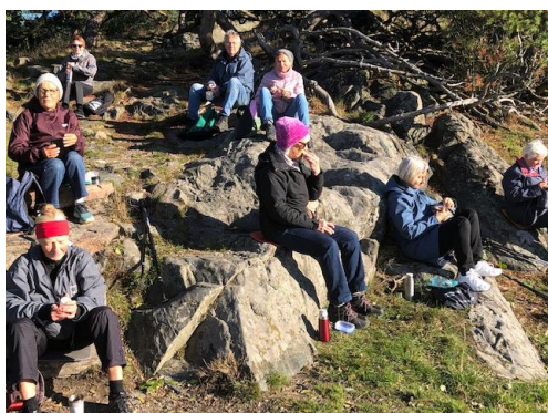
Fika med Stavgångsgänget