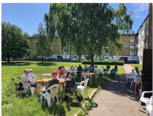
Tisdagsfika utanför kyrkan