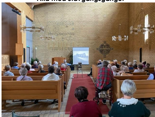
Föredrag på kultursalong